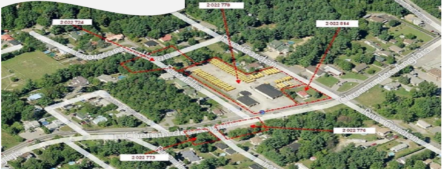
Terrain sur le Chemin des Anglais, Mascouche (Qc)